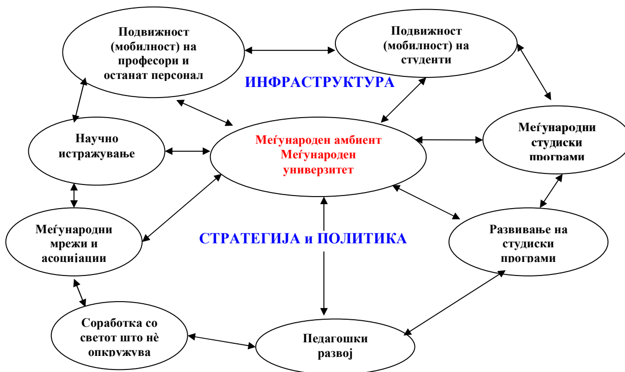
Диј. 1: Интернационализација - компоненти

Интернационализацијата на Универзитетот се состои од компоненти што произлегуваат од дефиницијата за интернационализација - што претставува интернационализација на УКЛО. За реализација на интернационализацијата потребна е, од една страна, инфраструктура, а од друга - стратегија и политика. Цел на интернационализацијата на УКЛО е создавање на Меѓународен амбиент - Меѓународен универзитет . (Диј.1).